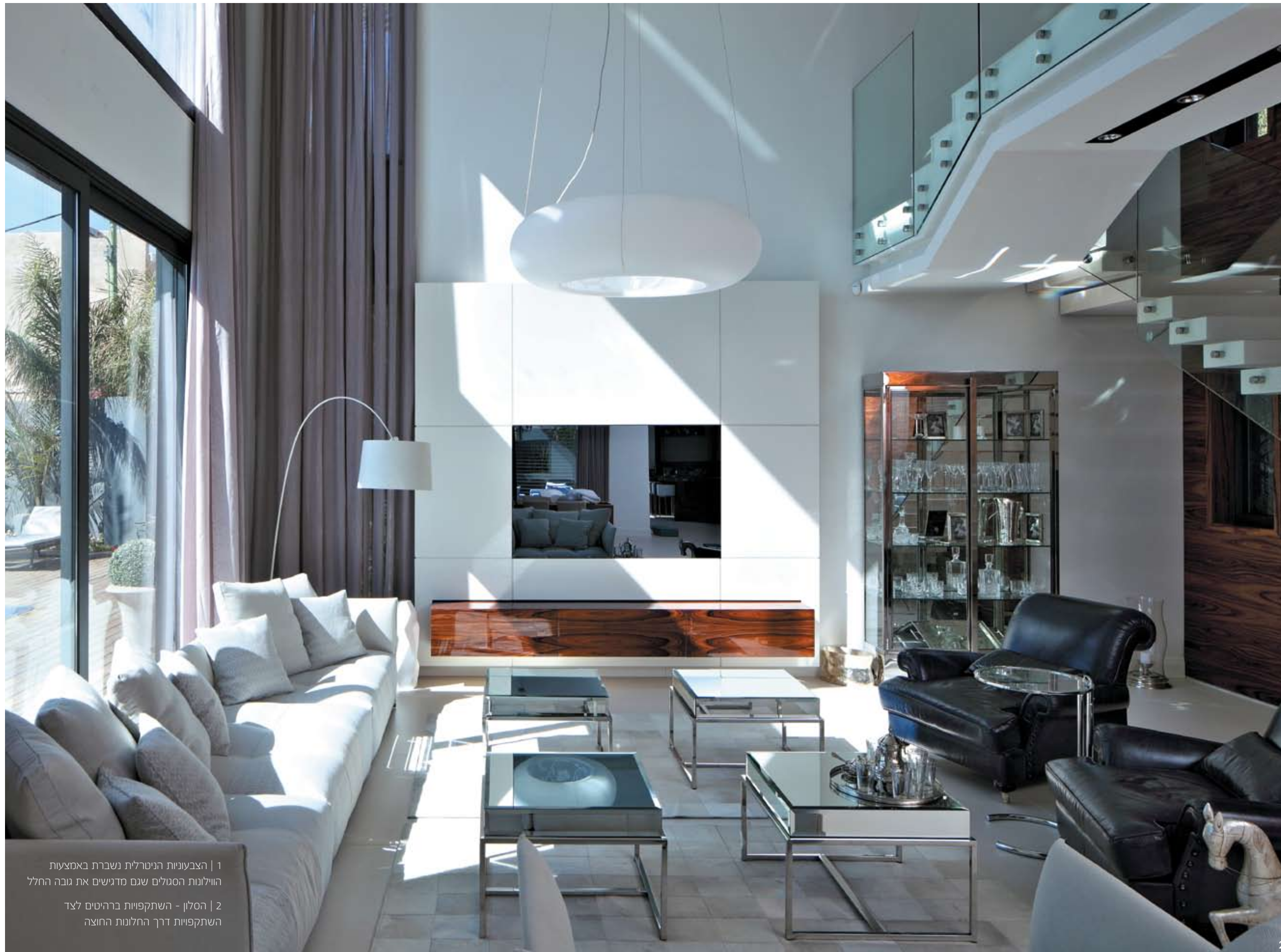
1 | הצבעוניות הניטרלית נשברת באמצעות הווילונות הסגולים שגם מדינשים את גובה החלל 2 | הסלון - השתקפויות ברהיטים לצד השתקפויות דרך החלונות החוצה