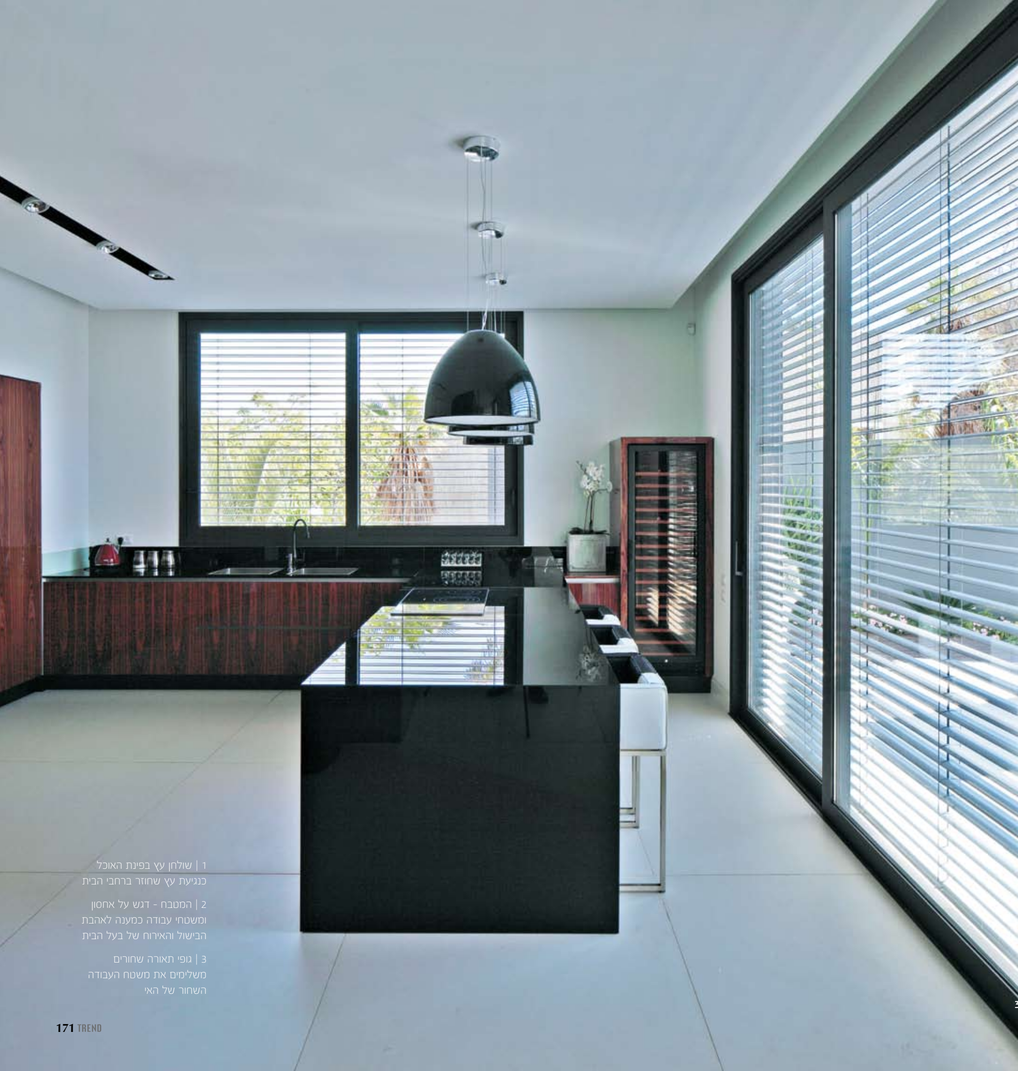
1 | שולחן עץ בפינת האוכל כניעת עץ שחוזר ברחבי הבית