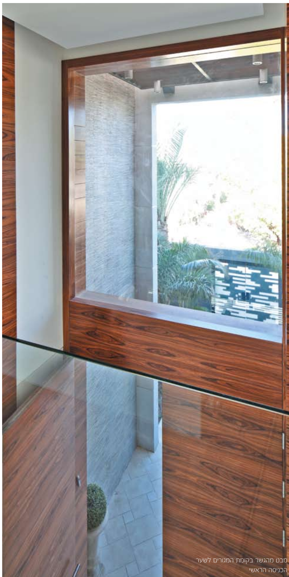
מבט מהגשר בקומת המגורים לשער הכניסה הראשי

בסיום המדרגות ישנו גשר שצופה לסלון ובכך מאפשר הצצה לחוץ גם מהקומה העליונה, כמו גם יוצר קשר עין בין שתי הקומות. גשר זה מוביל לקומת המגורים שמכילה חדר מאסטר וחדרי ילדים. הקומה מרוצפת פרקט לתחושה ביתית ועוטפת, והמרפסות שבה תורמות להכנסת החוץ לחלל הפרטי.